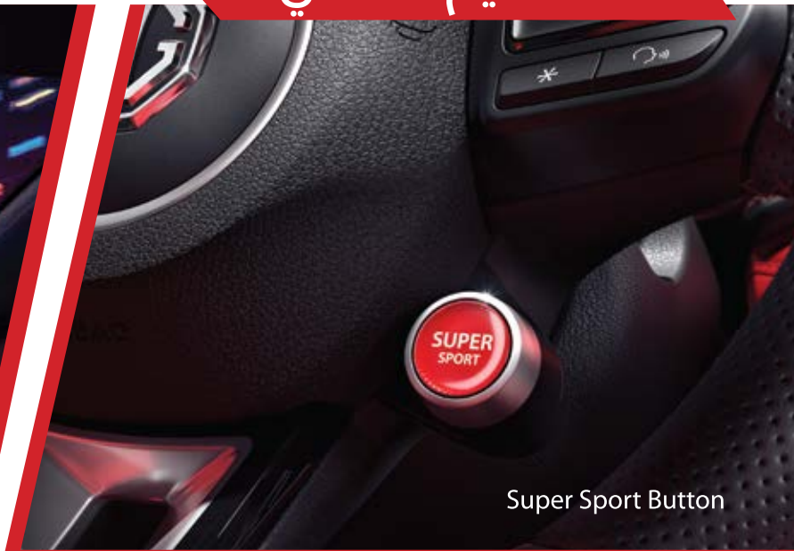
Super Sport Button