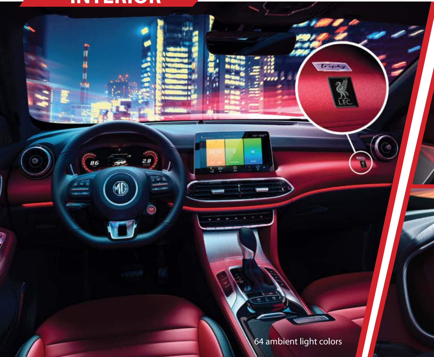
64 ambient light colors