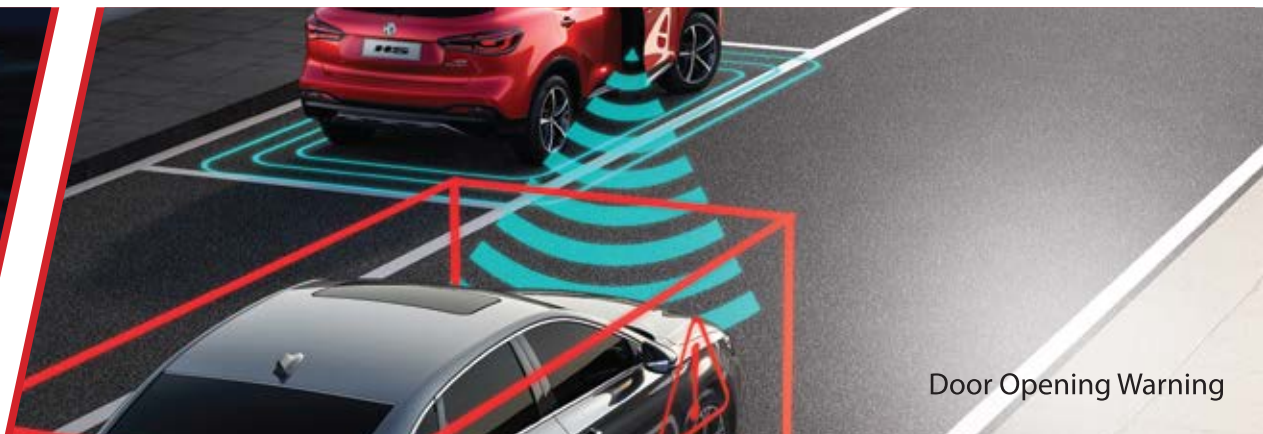
Door Opening Warning