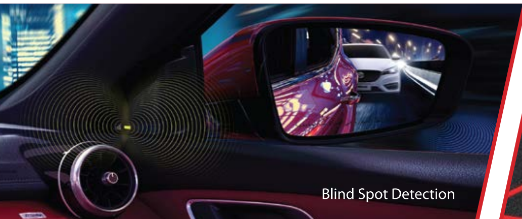
Blind Spot Detection