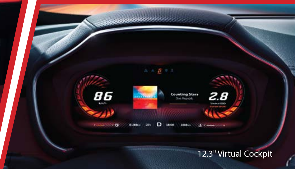
12.3" Virtual Cockpit